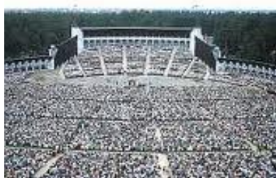
Riga, Mezaparks. Zangfestival.

Nog in de Russisch-tsaristische tijd, rond 1850, werden voor het eerst kranten uitgegeven in de Letse taal, werden Letse theaters gebouwd en verenigingen opgericht. Door een groeiende welvaart door industrialisatie kwam er ruimte voor een eigen Letse cultuur. In de architectuur uitte zich dat in grootschalige bouw in Jugendstil. In 1873 werd het eerste Letstalige Zangfestival georganiseerd, waar koren uit het hele land elkaar ontmoetten.