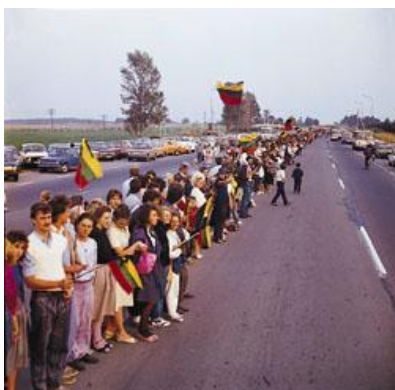
Via Baltica - singing revolution

In 1989 vormden inwoners van Estland, Letland en Litouwen een menselijke keten van Tallinn, via Riga, naar Vilnius om het Hitler-Stalin pact te gedenken. Dit was het begin van een geweldloos verzet tegen de communistische overheersing dat in 1991 zou leiden tot onafhankelijkheid van de Baltische staten.