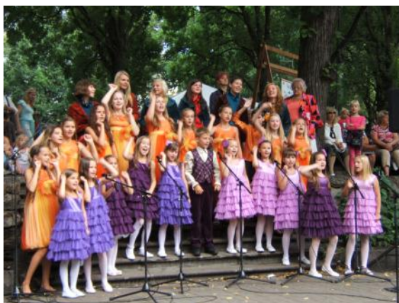
Drie leeftijdsgroepen van een jeugdensemble dat optreedt in een park in Riga.

Uit de USSR tijd zijn niet alleen negatieve zaken te melden. Destijds werd in elk dorp en elke stad een 'Cultuurhuis' neergezet, waar ruimte was voor koorzang, theater, dans, etc. Deze mogelijkheden-naast-de-deur hebben zeker ook bijgedragen aan een goede en vanzelfsprekende koorcultuur.